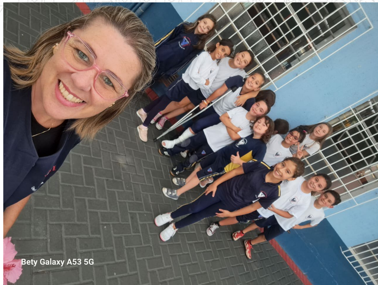
Bety Galaxy A53 5G