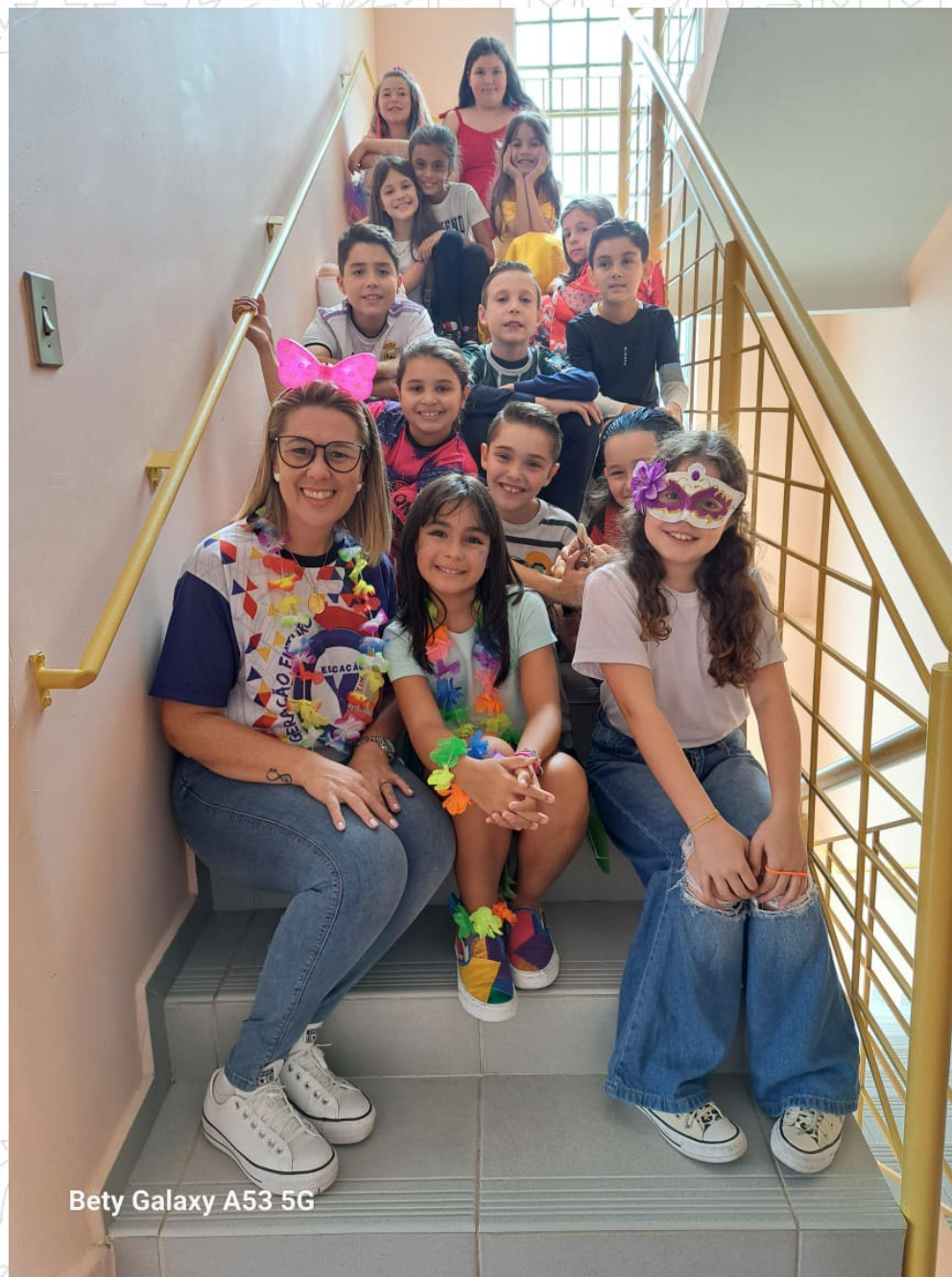
Bety Galaxy A53 5G